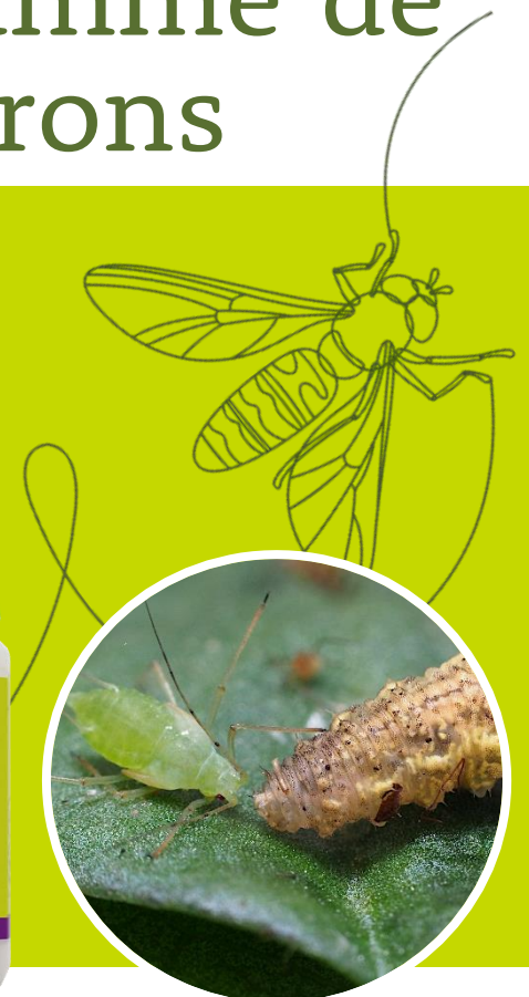
Larve d' Eupeodes corollae