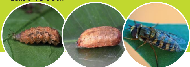
Larve, puppe et adulte d' Eupeodes corollae