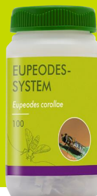
100 pupes par flacon