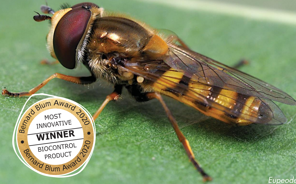
Eupeodes corollae adulte